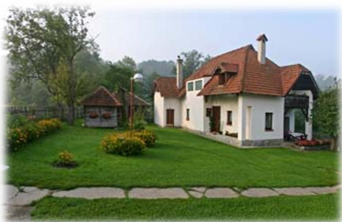
KUĆA ZA GOSTE