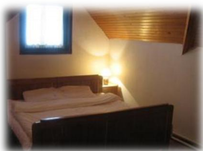
SOBA U KUĆI