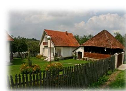
STARA KUĆA I KAČARA