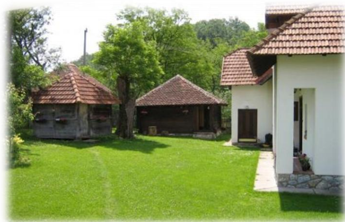
MLEKAR I STARI DEDIN VAJAT