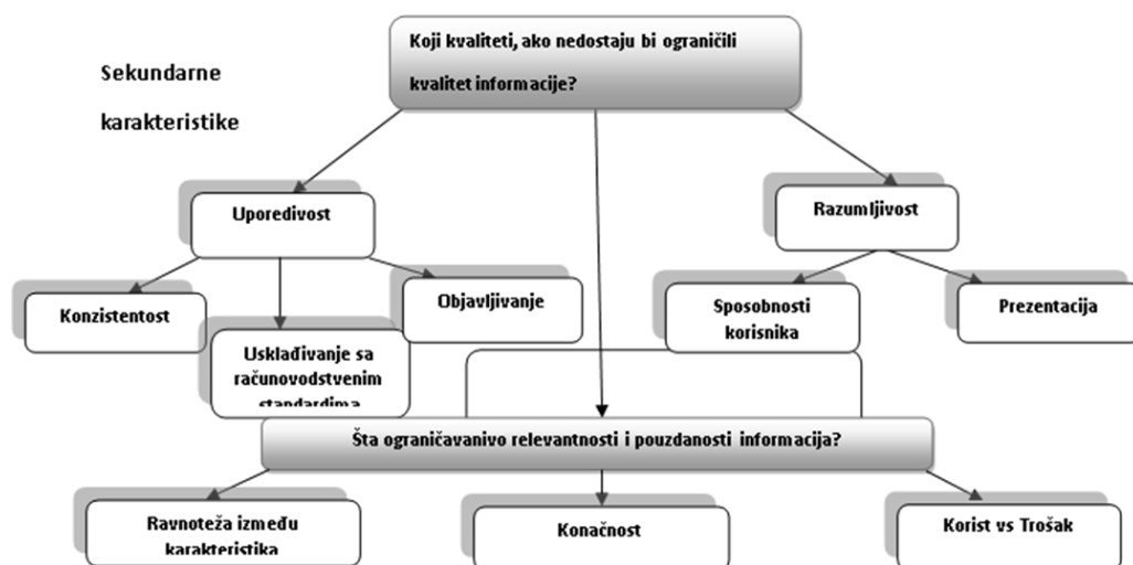
Slika 2. Sekundarne karakteristike informacija

Pored primarnih karakteristika informacija, postoje i sekundarne karakteristike. Sekundarne karakteristike mogu doprinositi kvalitetu informacija bez uticaja na pouzdanost i relativnost informacija (uporedivost i razumljivost), ali mogu delovati i ograničavajuće na primarne kvalitete finansijskih izveštaja (ravnoteža između karakteristika, konačnost, cost benefit), što se može predstaviti: